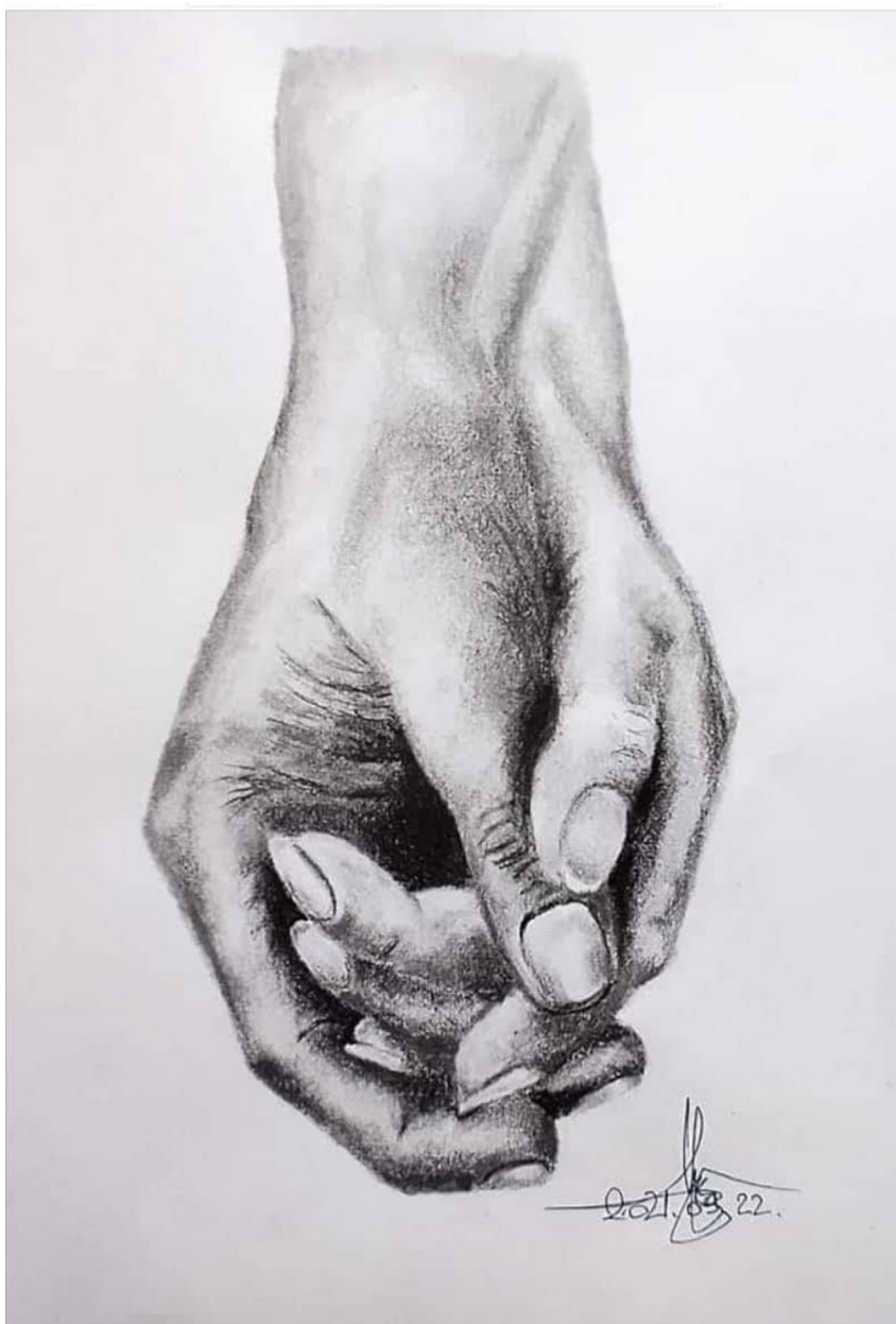
Illusztráció: Herczegfalvi György